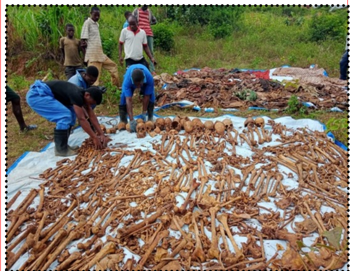
Séchage des ossements des fosses communes de Shari II

La CVR dans ses enquêtes a également su que des militants de la JRR, toutes ethnies confondues, Bahutu et Batutsi, ont été utilisés lors du génocide de 1972, mais à la fin, des militants de la JRR Bahutu ont été tués à leur tour.