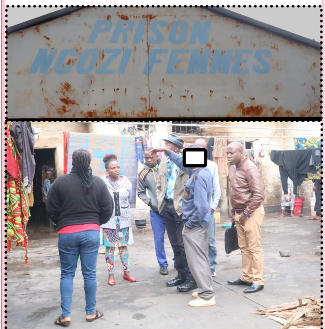
A l'intérieur de la prison femme de Ngozi, cet ancien prisonnier de 1972, K.B. explique aux enquêteurs de la CVR comment les gens étaient tués et conduites pour être jetées ailleurs

Actuellement, comme pour effacer toute trace de ces fosses communes, deux maisons ont été érigées à cet endroit du quartier appelé Gabiro, colline Muremera en 1972. La CVR a du pain sur la planche.