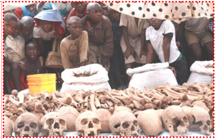
Les enfants de Bubanza découvrent l'horreur commis en mai-juin 1972

Dans ces fosses communes, la CVR y a découvert de nombreux vêtements, deux menottes et d'autres objets : menottes, peignes, clés pour cadenas, papiers d'identité, cordes, etc.